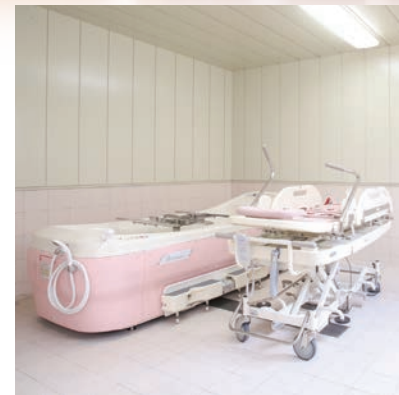
浴室 寝たきりの方や車いすの方も安全・快適に入浴していただけるよう、移動のない機械浴を完備しています。