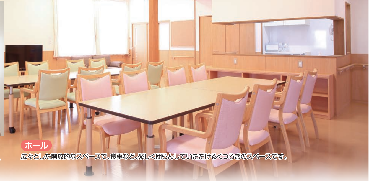
ホール 広々とした開放的なスペースで、食事など、楽しく団らんしていただけるくつろぎのスペースです。