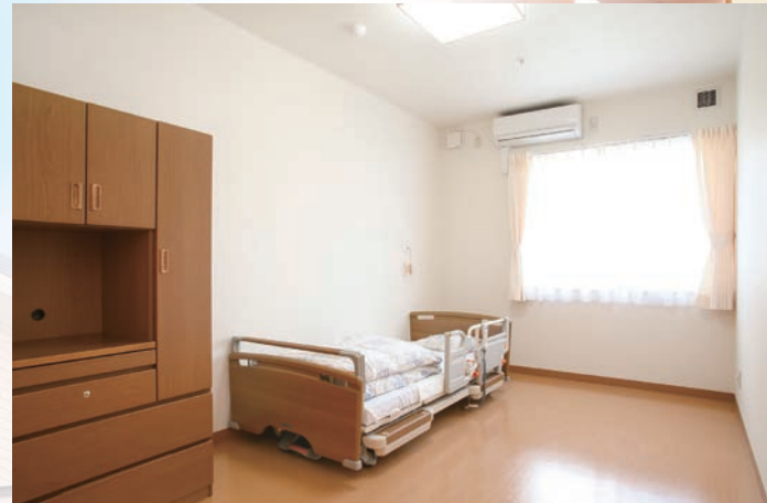
居室 安心して自分だけの時間を過ごすことができる完全個室。冷暖房完備で、窓からの景色が心を癒してくれる快適なプライベート空間です。