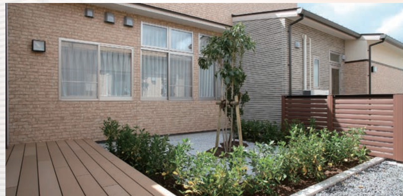
中庭スペース 季節の移ろいを楽しませてくれる中庭です。