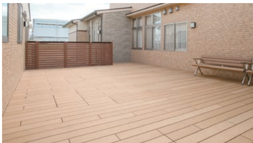
ウッドデッキスペース 天気の良い日は、広いウッドデッキスペースでごゆっくりしていただけます。