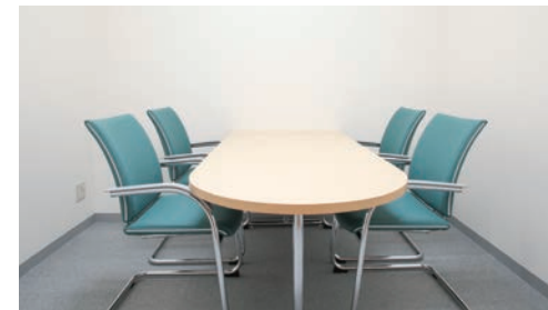
相談室 相談室では、入所の相談、入居者様の生活上の相談などを行っております。