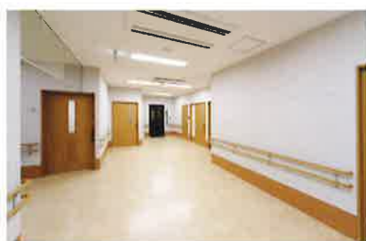
エントランス 広々とした開放的なスペースです。