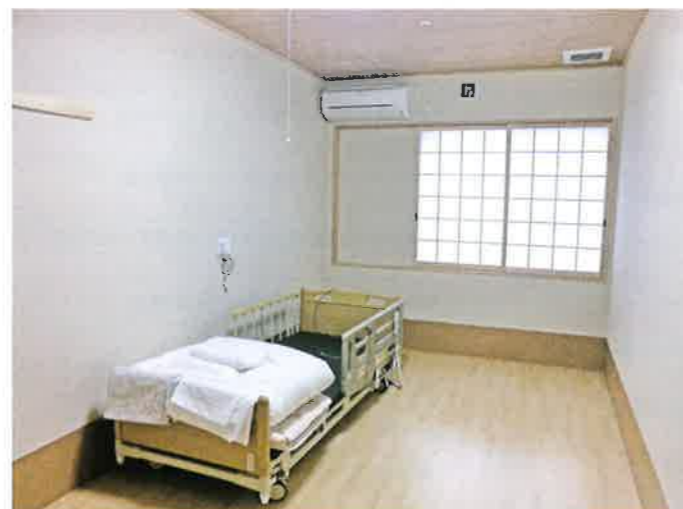
居室 冷暖房完備で、快適に安心して自分だけの時間を過ごすことができる完全個室です。