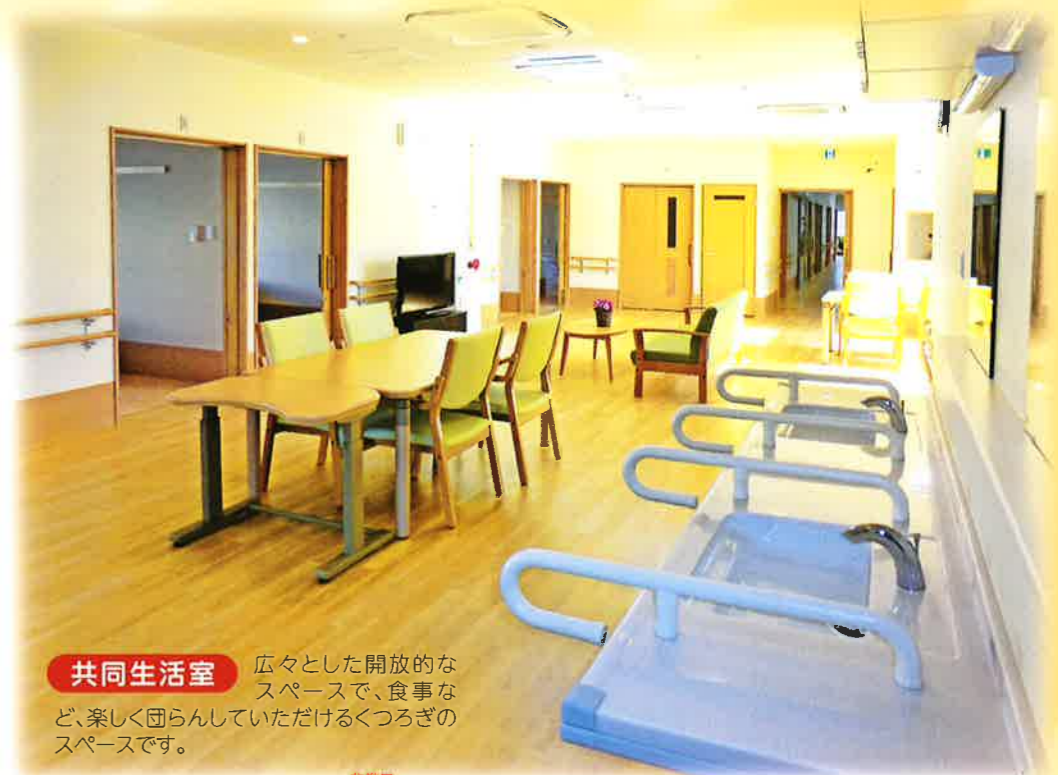
共同生活室 広々とした開放的なスペースで、食事など、楽しく団らんしていただけるくつろぎのスペースです。