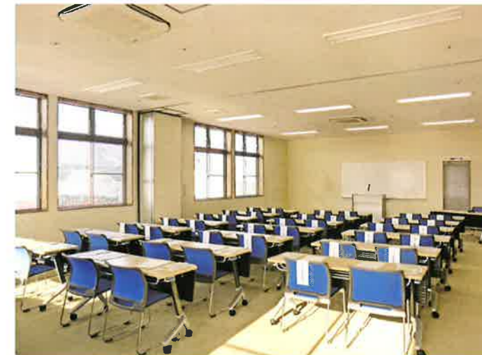
研修室 談話やイベント、運動などのスペースとしてご利用いただけます。