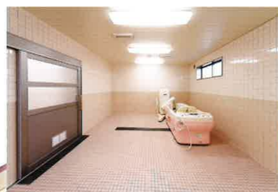
浴室 寝たきりの方や車いすの方も安全・快適に入浴していただけるよう、機械浴を完備しています。