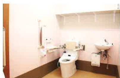
トイレ 車いすの方でも安心の広々設計。背もたれや収納式の肘置きなど、長時間座っていても疲れにくい使いやすい工夫をしております。