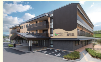
▲草津市にある 特別養護老人ホーム風和里

年を取ったり、病気になったりして体を思うように動かさない人を介護するお仕事をしています。利用者一人ひとりの思いや生活スタイルに合わせて、自宅で暮らすことが難しくなった人が入る施設や、自宅で暮らしたい人への訪問サービスなど、さまざまな形の介護を用意して、利用者が自分らしい生活を送るためのお世話や健康管理をしています。